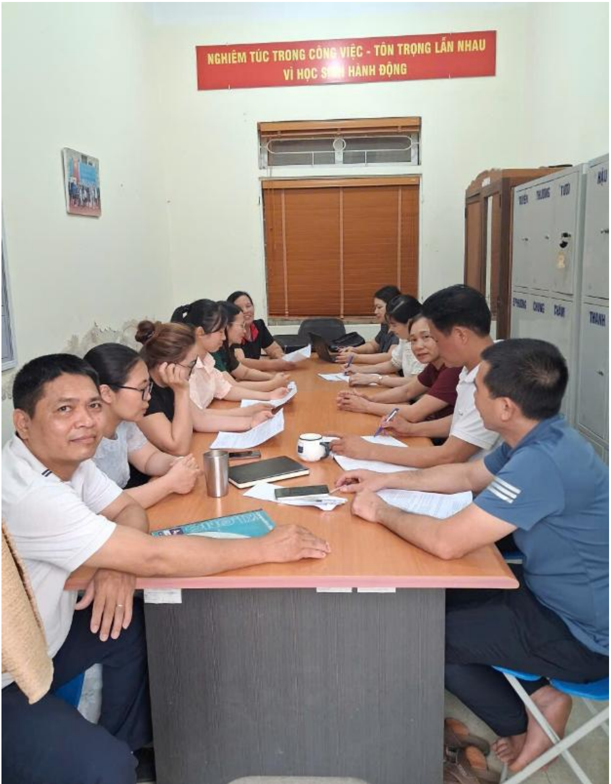
Họp tổ nhận xét, rút kinh nghiệm giờ dạy.