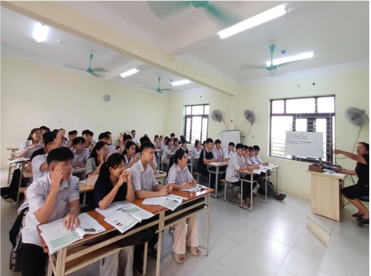
Một số hình ảnh tiết học tại lớp