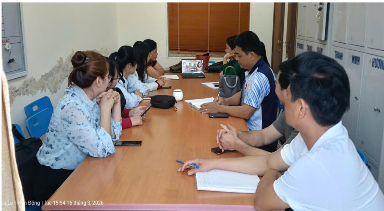
Họp tổ chuyên môn lựa chọn chủ đề/bài học