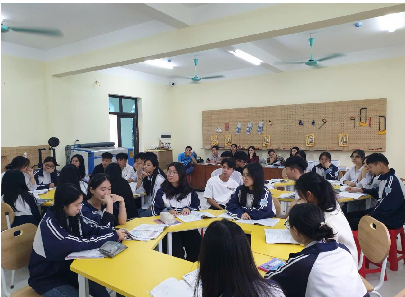
Các thầy cô tham dự tiết học