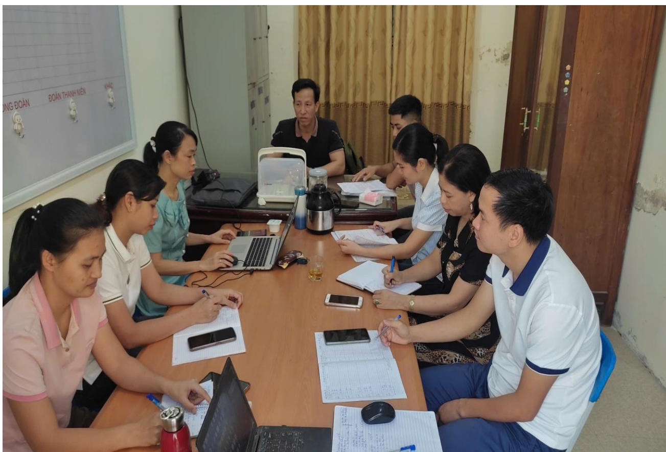
Họp tổ, nhóm chuyên môn chuẩn bị cho bài dạy

Sau đây là một số hình ảnh về sự chuẩn bị của tổ - nhóm chuyên môn xây dựng bài dạy và một số hình ảnh của thầy và trò trong tiết học: