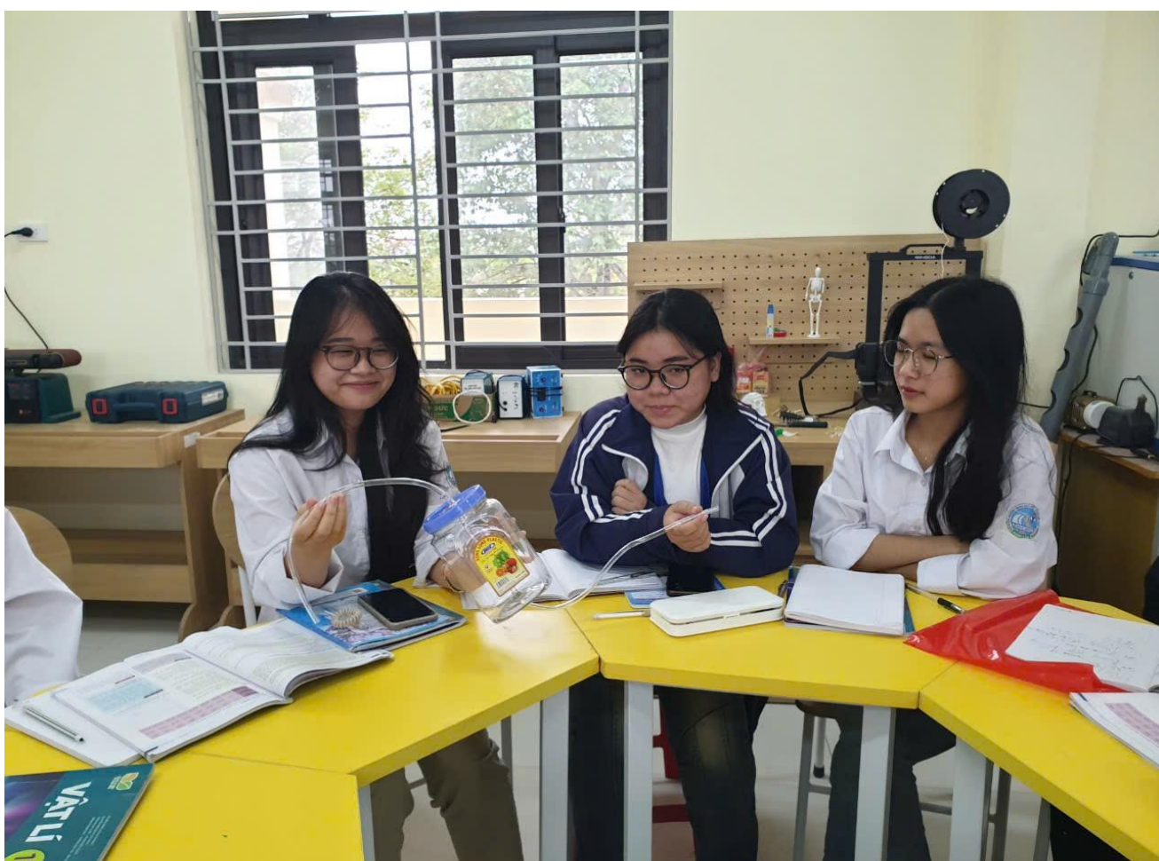
Các nhóm trình bày, báo cáo sản phẩm