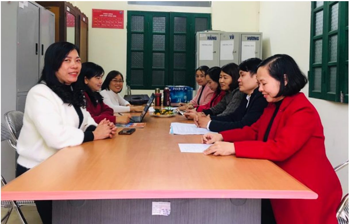
Các thầy/cô trong tổ Sử - Địa – GDCD họp rút kinh nghiệm tiết học