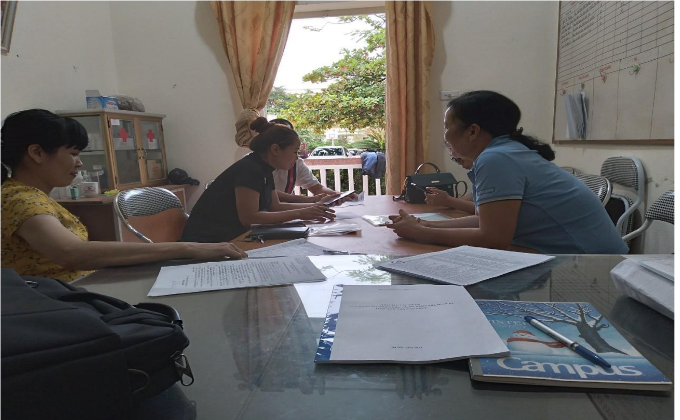
Họp tổ chuyên môn theo hướng nghiên cứu bài học môn học