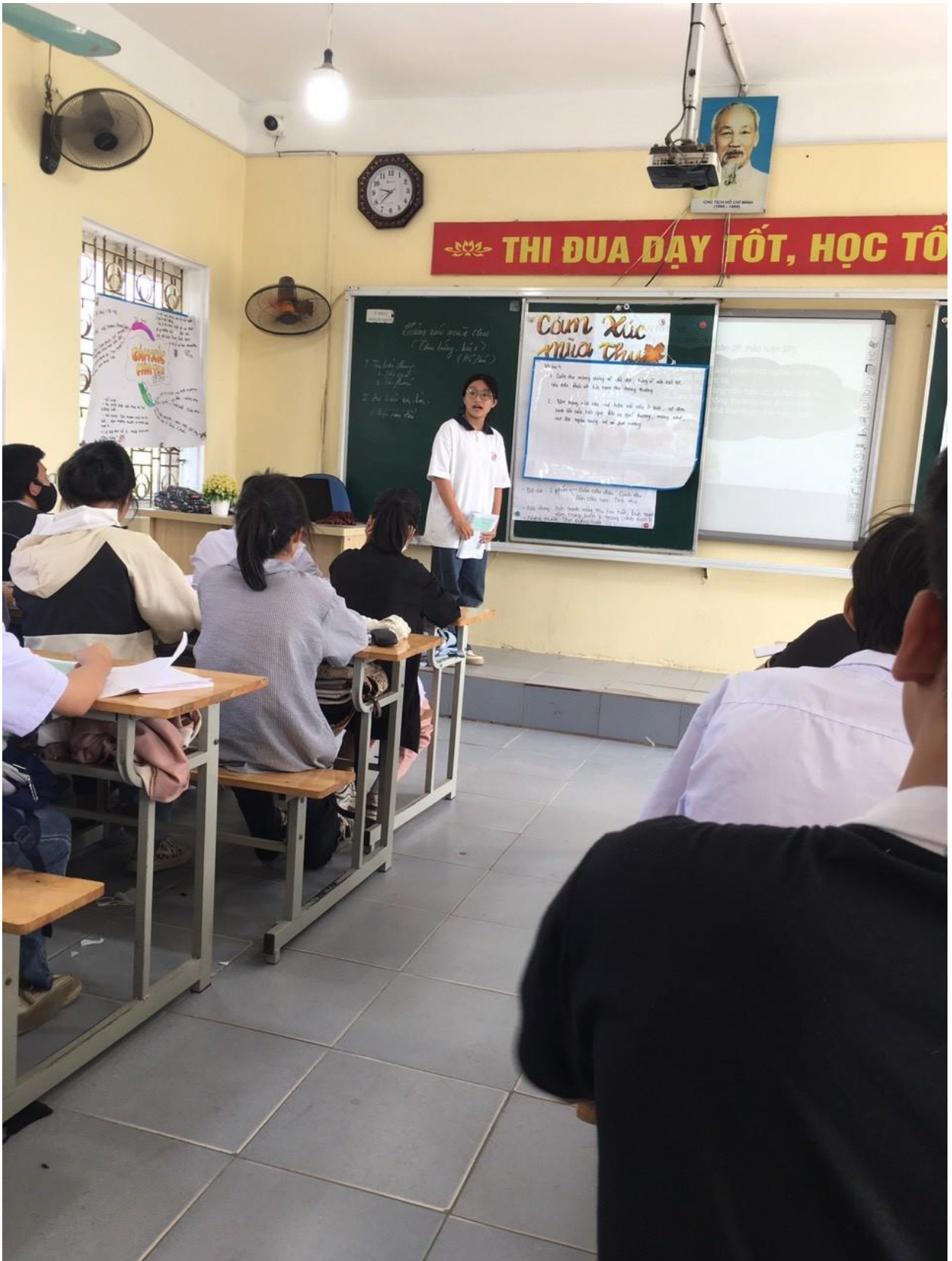
Báo cáo kết quả thảo luận