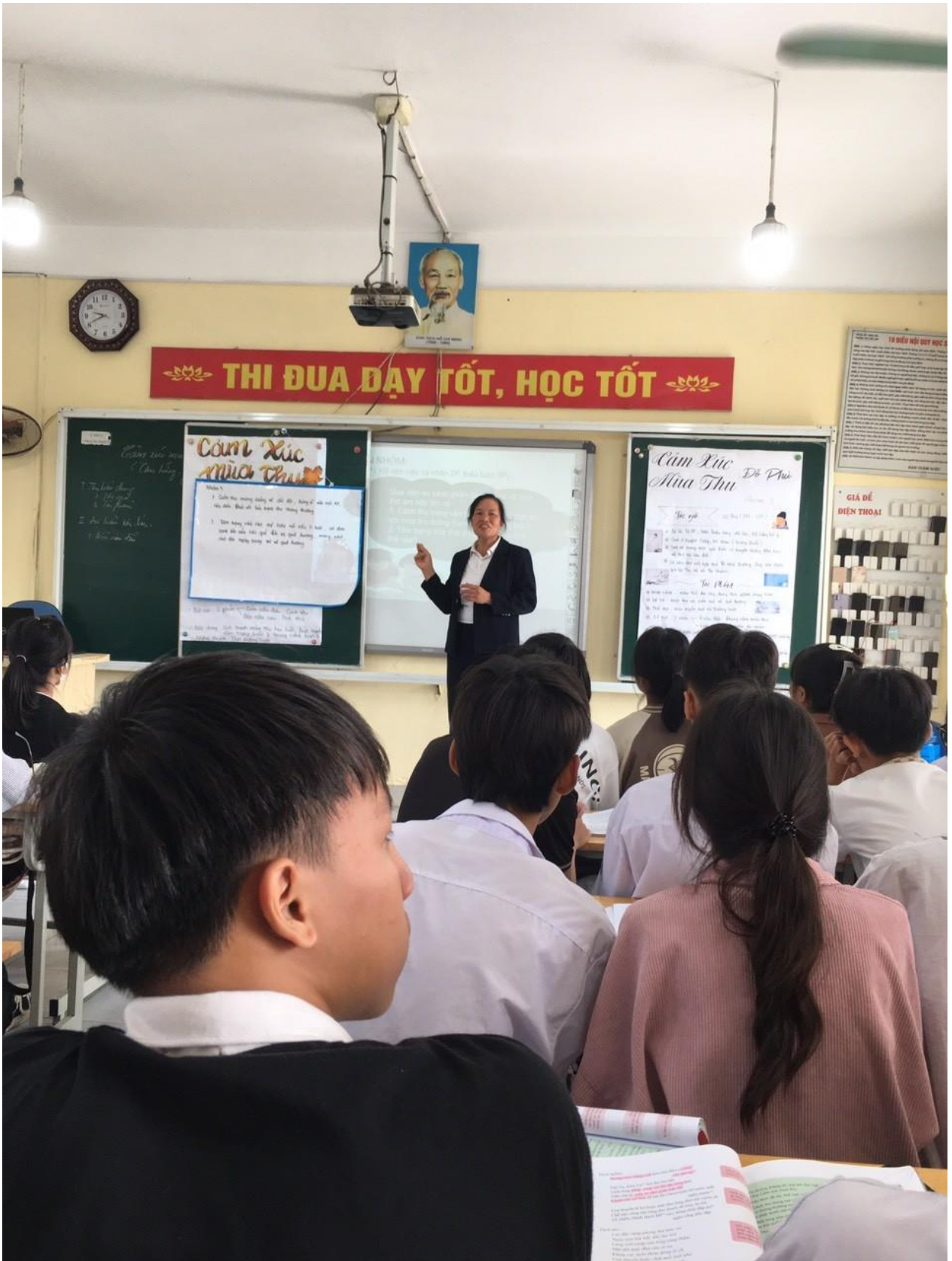
Giáo viên nhận xét, đánh giá sản phẩm thảo luận nhóm