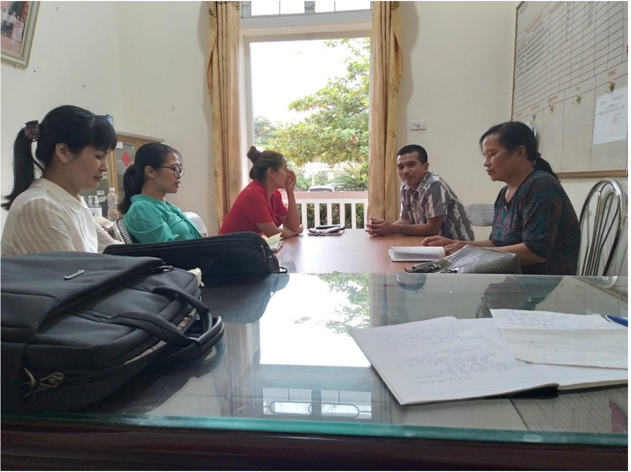
Rút kinh nghiệm sau giờ dạy