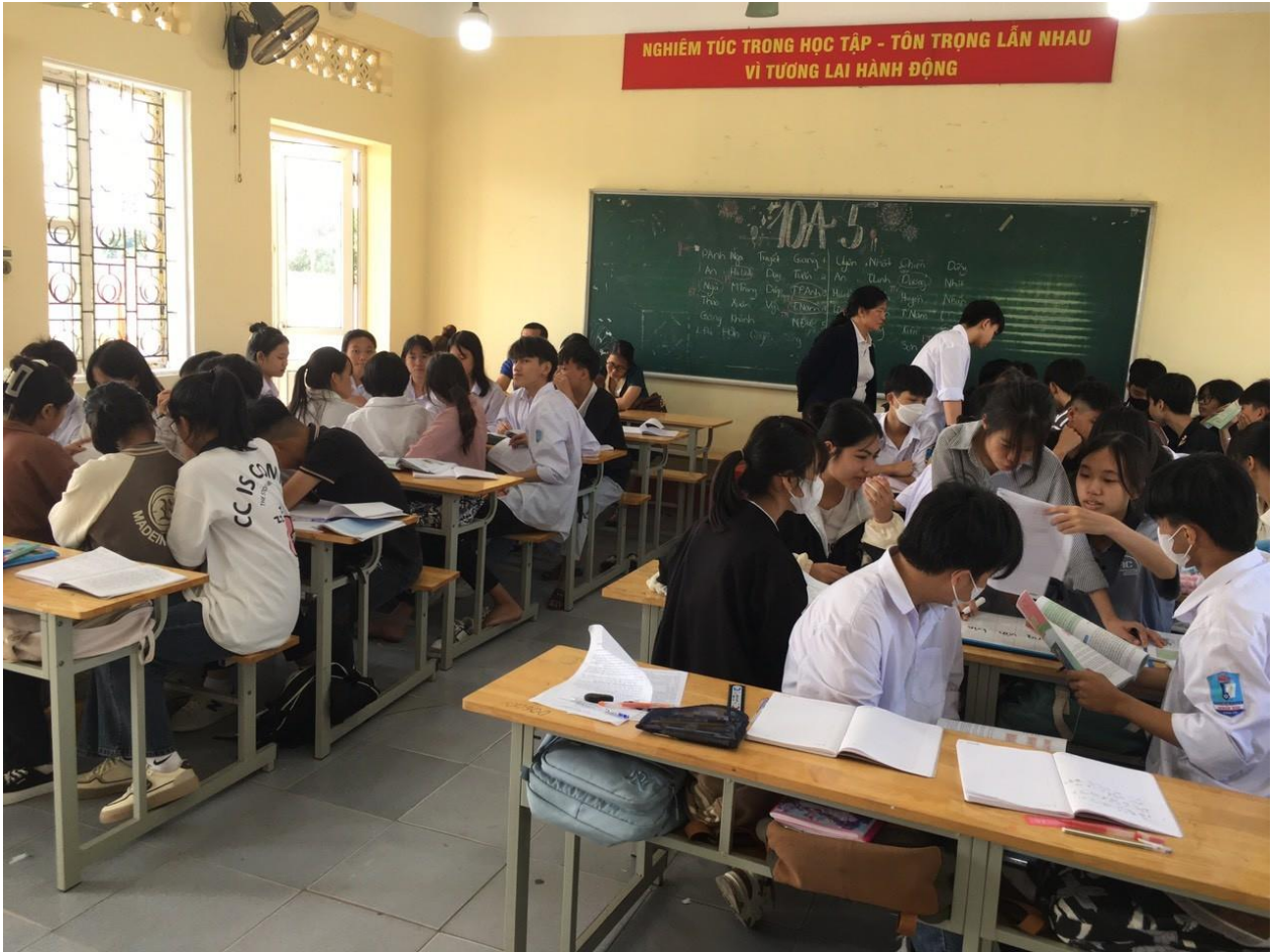
Các nhóm tiếp nhận nhiệm vụ, tích cực trao đổi dưới sự hỗ trợ của giáo viên