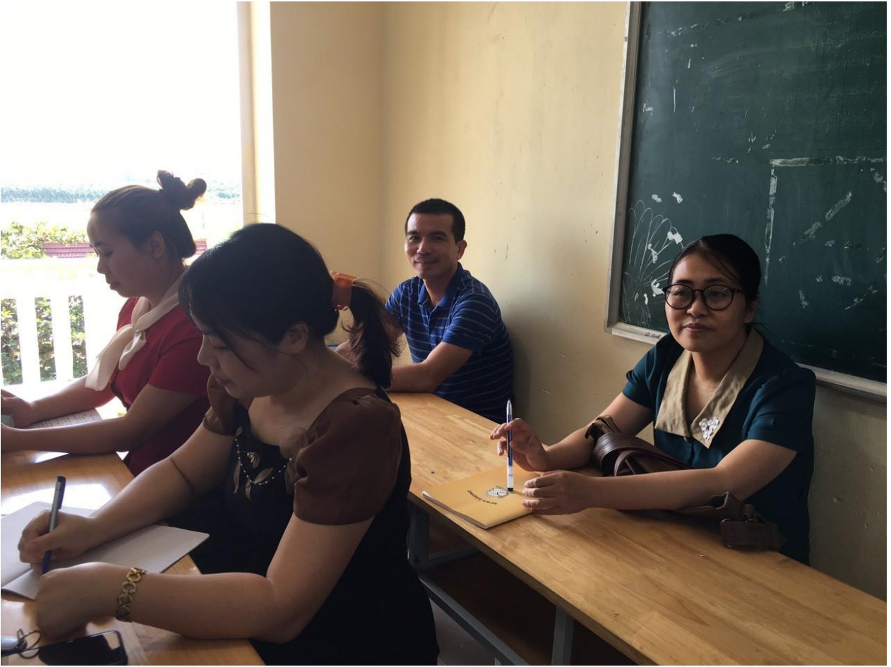
Các thầy cô dự giờ nghiêm túc